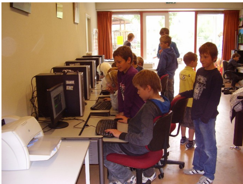
Drukte bij de computers.